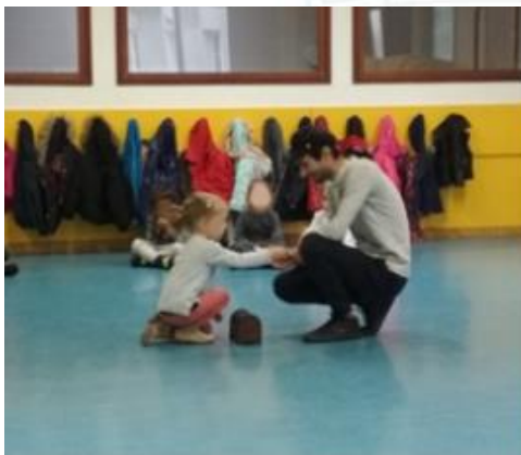
Participation financière au théâtre