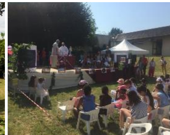
Organisation de la logistique et restauration de la Kermesse