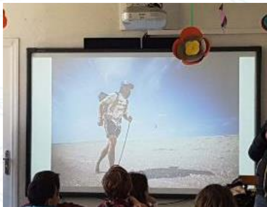
Achat de matériel : Tableaux interactifs