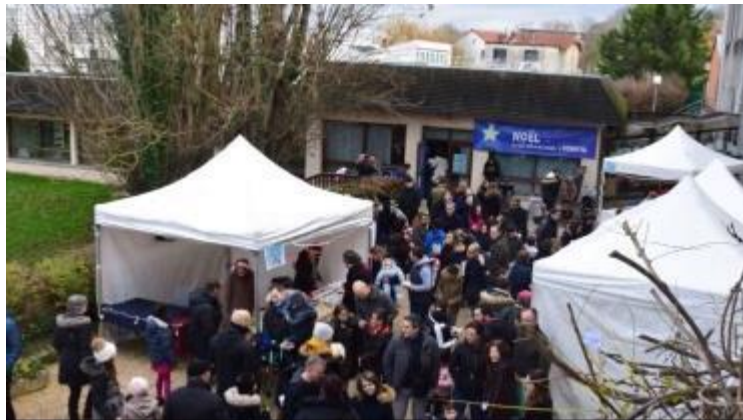
Participation au marché de Noël